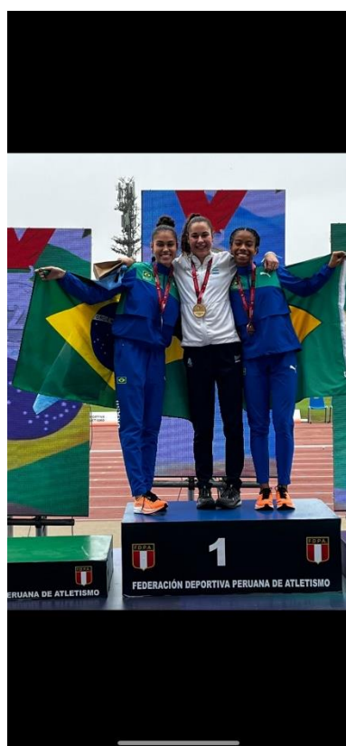
TERCEIRO LUGAR NOS 1500m SUL-AMERICANO SUB-20 – LIMA – 2004