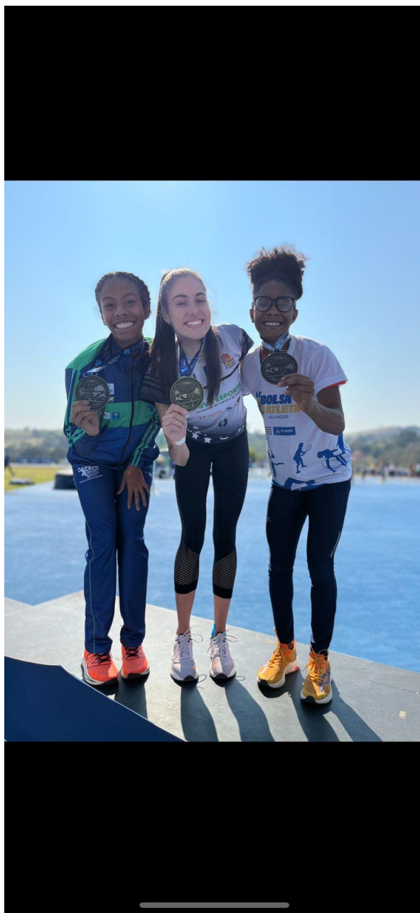
SEGUNDO LUGAR NO BRASILEIRO SUB-23 – SP – 2024