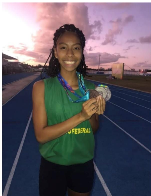
JOGOS ESCOLARES DA JUVENTUDE 2022, UMA MEDALHA DE BRONZE E DUAS DE PRATA (400M, 800M E REVEZAMENTO 4X400 MISTO, RESPECTIVAMENTE)