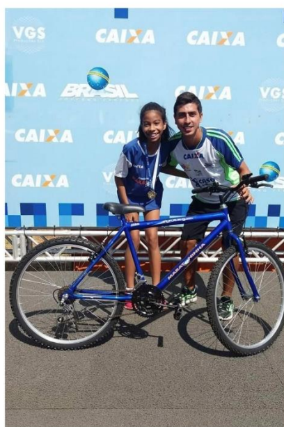
CAMPEÃ MARATONINHA DE 2017 – COM CAIO BONFIM, MEDALHISTA MUNDIAL NA MARCHA ATLÉTICA