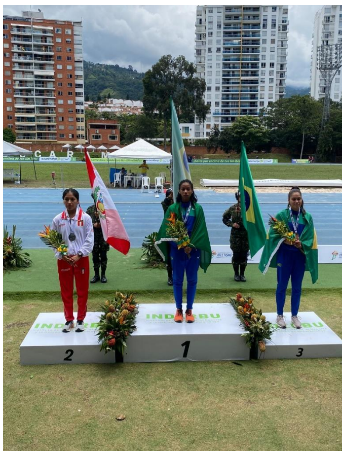
CAMPEÃ NOS 800m DO SUL-AMERICANO SUB-23 – 2024- BUCARAMANGA - COLOMBIA