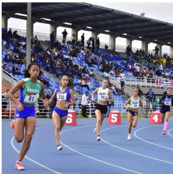
SUL-AMERICANO SUB-20, BOGOTÁ – COLÔMBIA (2023) BRONZE 800M