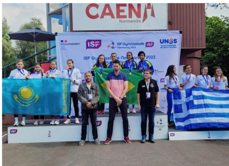
CAMPEÃ MUNDIAL GYMNASIADE NO REVEZAMENTO MEDLEY LONGO (200M, 400M, 600M, 800M) – 2022, NORMANDIA/FRANÇA