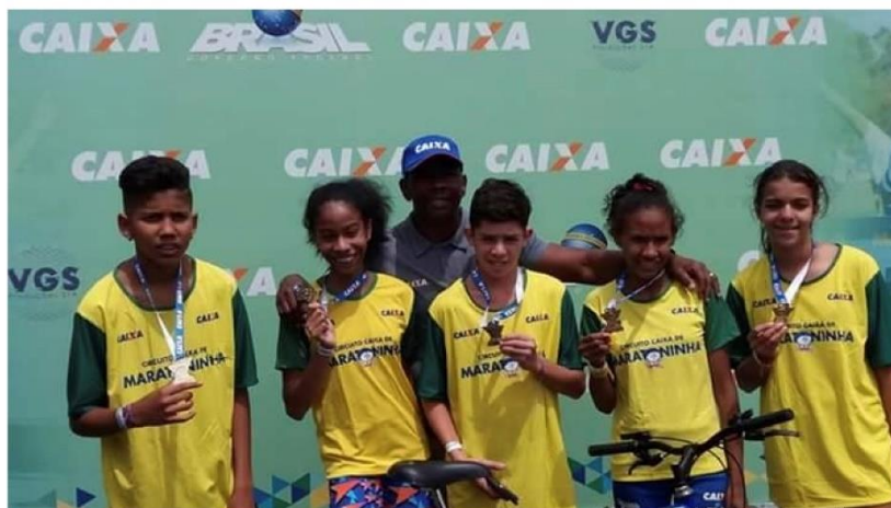
CAMPEÃ MARATONINHA DE 2018