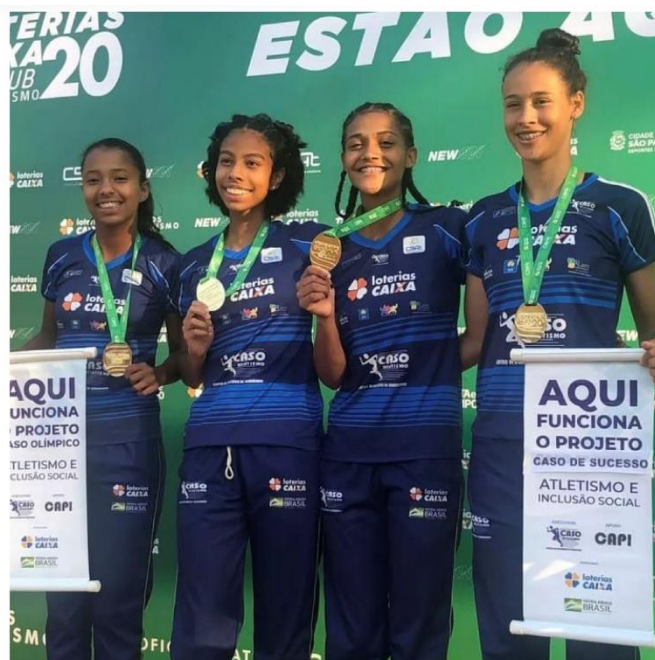
PÓDIO REVEZAMENTO 4X400 FEMININO 2022 CAMPEONATO BRASILEIRO SUB-20