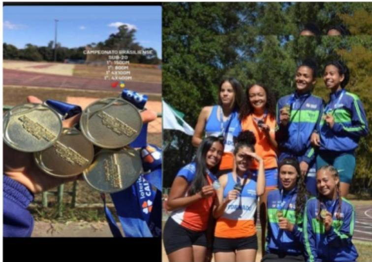
ALGUMAS DAS MEDALHAS E PREMIAÇÕES DE CAMPEONATOS BRASILIENSES EM 2022