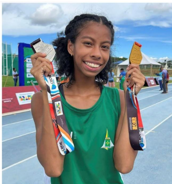
MEDALHA DE OURO NOS 800M E DE PRATA (SÉRIE BRONZE) NO SALTO EM DISTÂNCIA – CAMPEONATO BRASILEIRO ESCOLAR, MARÇO, 2023