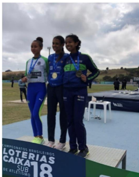
TERCEIRO LUGAR NOS 400M – BRASILEIRO SUB-18, 2022