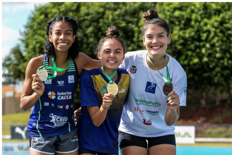
PÓDIO 1.500M, CAMPEONATO BRASILEIRO SUB-20, 2023