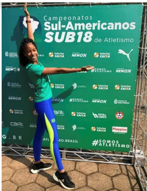
SUL-AMERICANO SUB-18, SÃO PAULO-SP, 2022 FINALISTA 800M