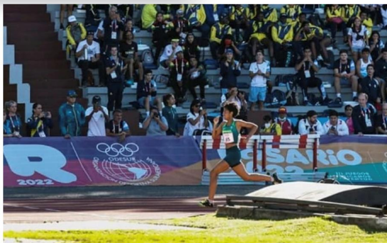
JOGOS SUL-AMERICANOS DA JUVENTUDE, ROSÁRIO – ARGENTINA, 2022