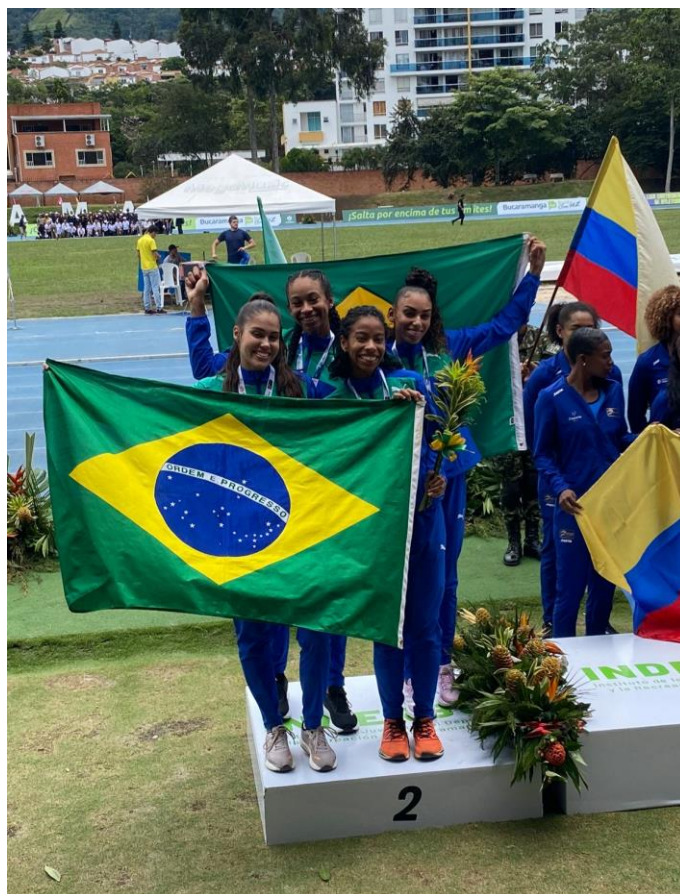
SEGUNDO LUGAR NOS 4X400m - SUL-AMERICANO SUB-23 – 2024- BUCARAMANGA - COLOMBIA