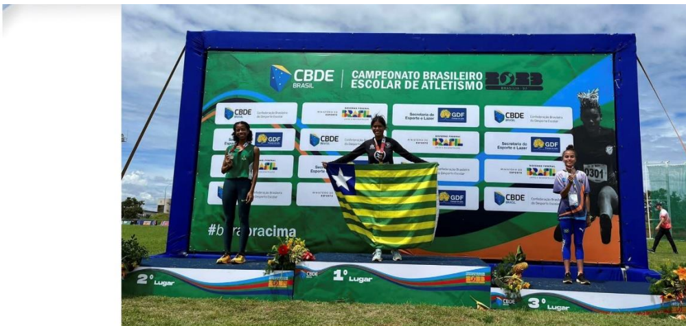
PÓDIO SALTO EM DISTÂNCIA, CAMPEONATO BRASILEIRO ESCOLAR