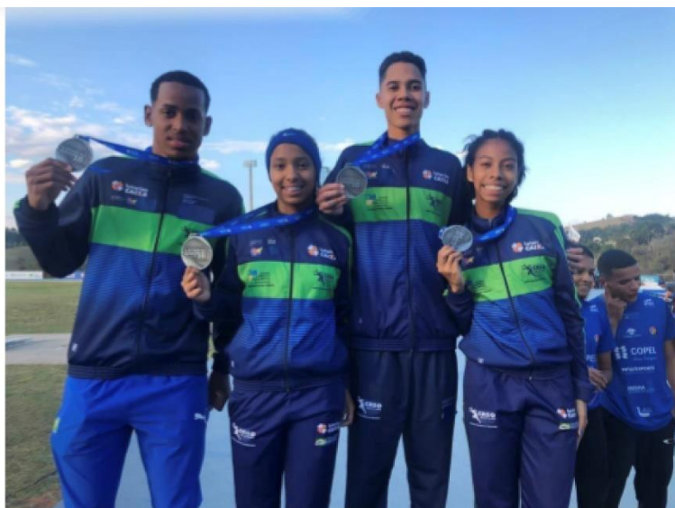
EQUIPE CASO VICE-CAMPEÃ DO REVEZAMENTO 4X400M MISTO NO CAMPEONATO BRASILEIRO SUB-18 (BRAGANÇA PAULISTA – SP), 2022