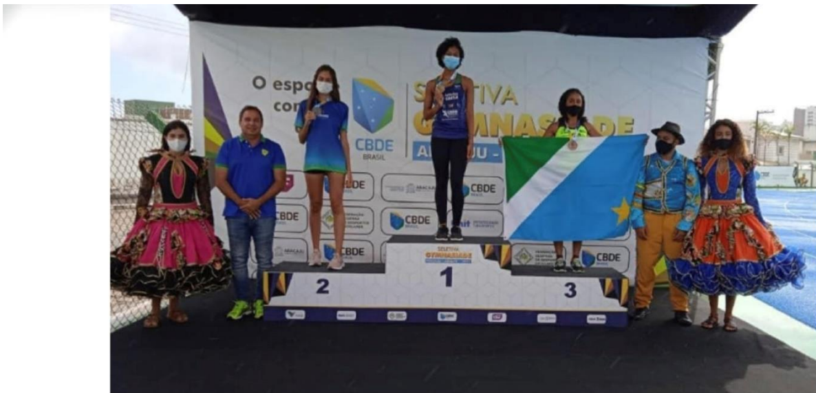
CAMPEÃ BRASILEIRA NA SELETIVA ESCOLAR PARA O MUNDIAL ESCOLAR GYMNASIADE, NA PROVA DE 800M (ARACAJU – SERGIPE), 08 E 09 DE MARÇO DE 2022