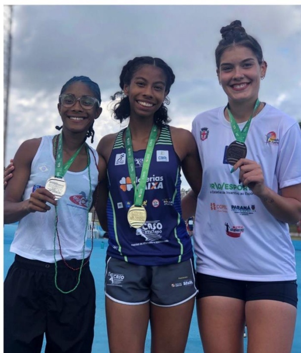
CAMPEÃ BRASILEIRA 800M CAMPEONATO BRASILEIRO DE ATLETISMO SUB-20 2023 (CASCAVEL – PARANÁ)