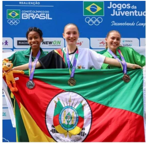
JOGOS DA JUVENTUDE 2023 OURO 800M, BATENDO O RECORDE DO CAMPEONATO PRATA 3.000M E BRONZE REVEZAMENTO 4X400M MISTO