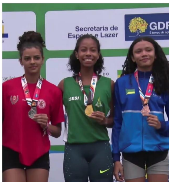
PÓDIO 800M, CAMPEONATO BRASILEIRO ESCOLAR