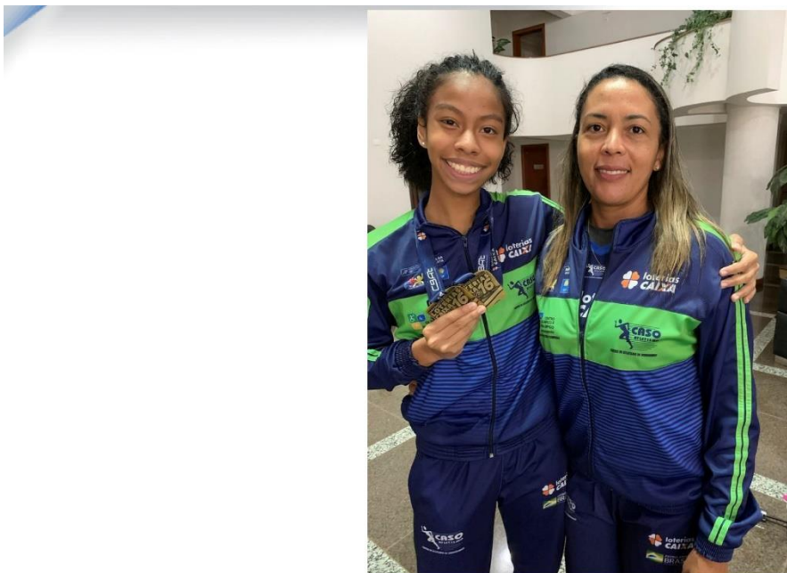
DUAS MEDALHAS DE BRONZE NO BRASILEIRO SUB-16 NAS PROVAS DE 250M E 1.000M, 2021 (CASCAVEL – PARANÁ)