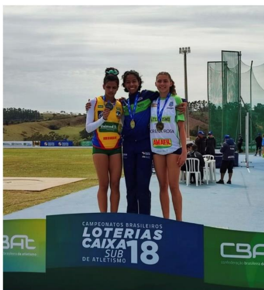
CAMPEÃ BRASILEIRA SUB-18 – 800M