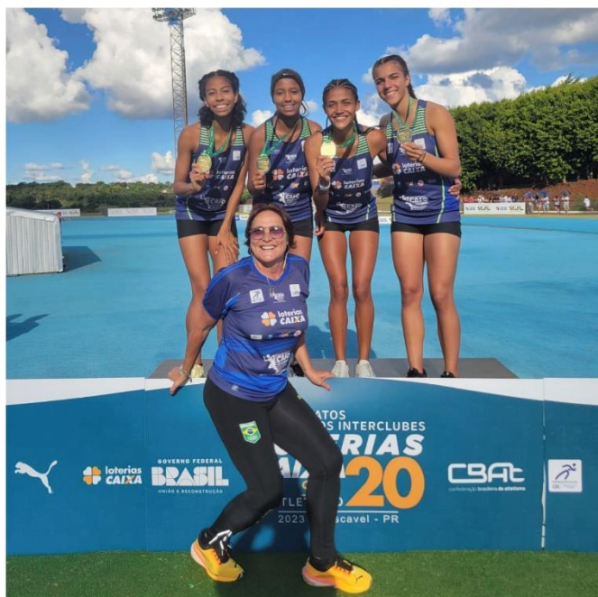
PÓDIO REVEZAMENTO 4X400 FEMININO CAMPEONATO BRASILEIRO SUB-20 BICAMPEÃS (2022, 2023)