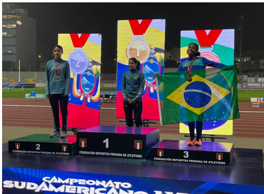
TERCEIRO LUGAR NOS 800M NO SUL-AMERICANO SUB-20 – LIMA – 2024