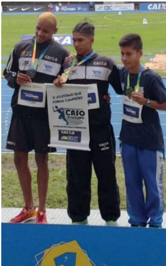
SUA PRIMEIRA MEDALHA EM BRASILEIRO – SEGUNDO LUGAR – SUB-18 – PORTO ALEGRE – RS