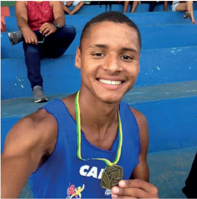
SUA PRIMEIRA MEDALHA – NO PRÓ-ÍNDICE DO D.F. FEV DE 2019.