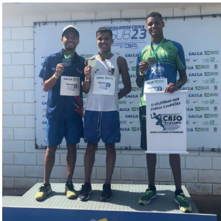
FECHA O ANO DE 2020 COM O TERCEIRO LUGAR NO BRASILEIRO SUB-23. 20.000M, CONSOLIDA A SUA ESCOLHA DE SER GRANDE MARCHADOR. .