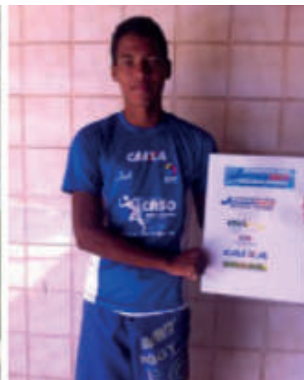
MAX NO CAMPEONATO BRASILEIRO JUVENIL INTERCLUBES