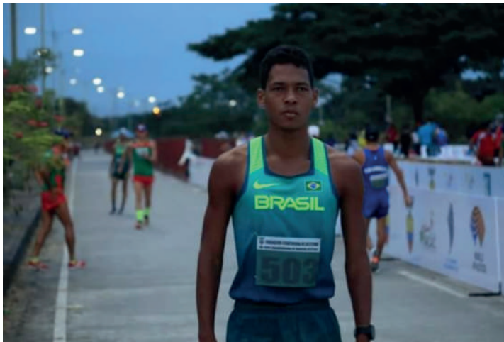
MAX EM GUAYAQUIL, ANTES DOS 50KM