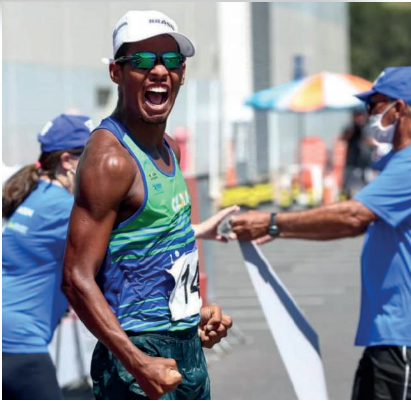
MAX COMEMORA A SUA VITÓRIA NOS 50KM DA COPA BRASIL DE MARCHA – SP.