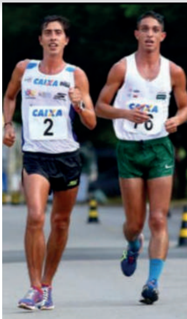
CAIO NA LUTA PELA VITÓRIA