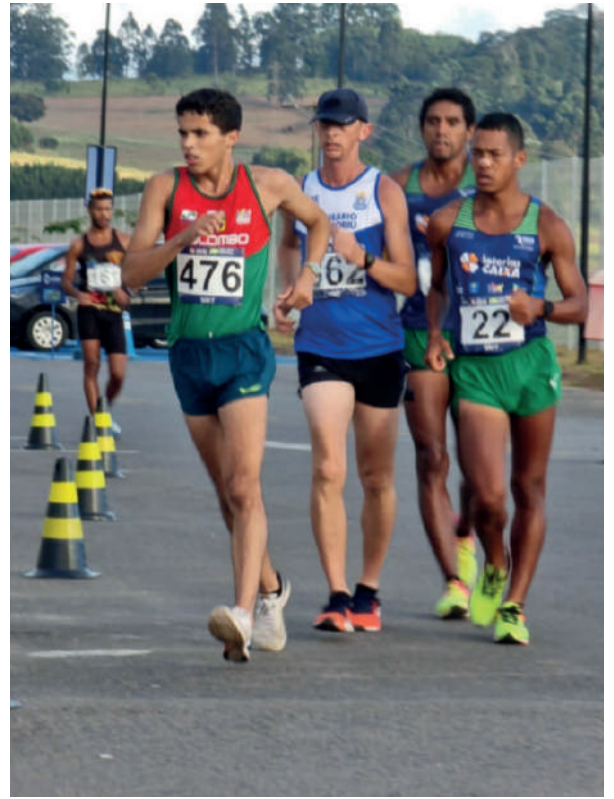
MAX EM AÇÃO NO TROFÉU BRASIL 35KM, SEGUNDO LUGAR (JUNHO 2021), BRAGANÇA PAULISTA – SP.