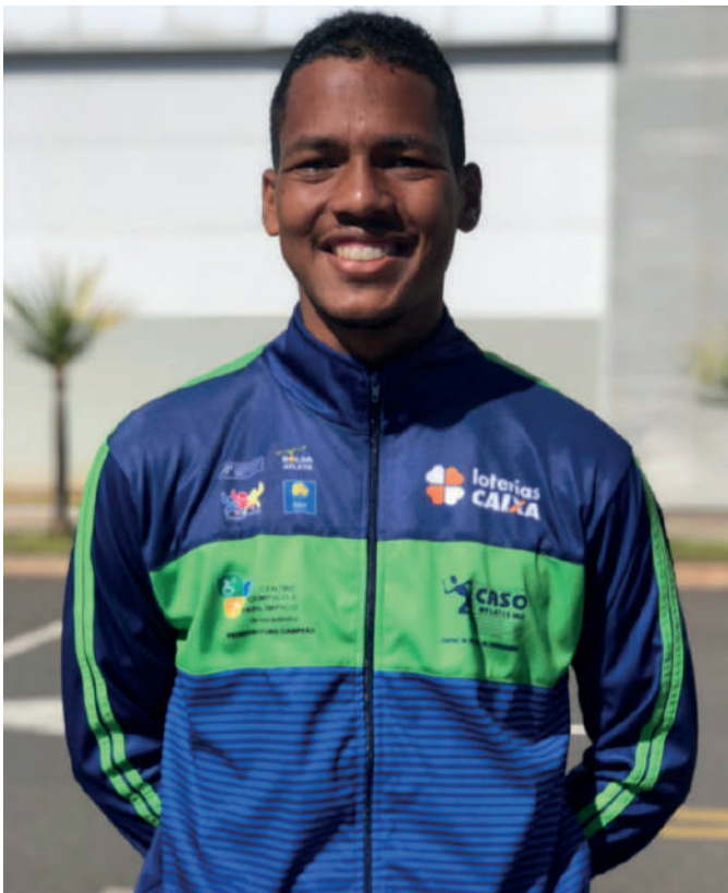
MAX ANTES DOS 35KM DO TROFÉU BRASIL 2021 (SEGUNDO LUGAR)