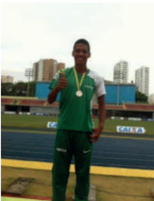
MAX MEDALHA DE PRATA NO CAMPEONATO BRASILEIRO DE JUVENIS-2014